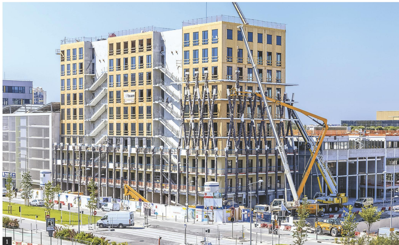
ANTOINE DUHAMEL / LEMONTEUR