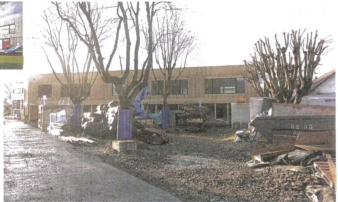
Epina y, mercredi. L'école Victor-Schoelcher, conçue pour être 100 % écolo, ouvrira en septembre.

L'objectif est de garder les calories dépensées à l'intérieur — qui produisent la chaleur humaine — car elles seront, avec les rayons du soleil, les sources principales de chauffage. « Pour l'ensemble des